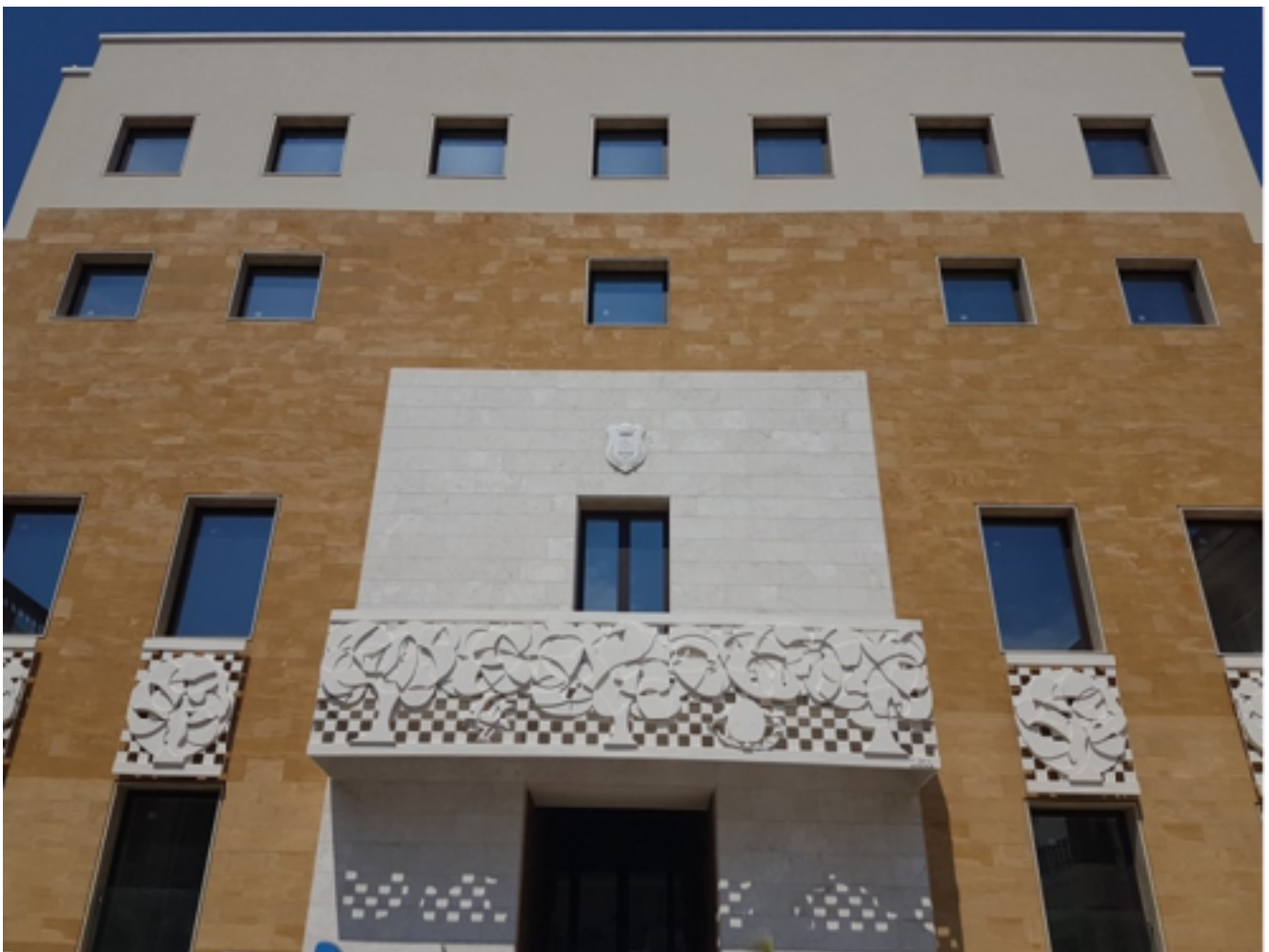
Disma Tumminello, la nuova facciata del Palazzo comunale di Mazara del Vallo