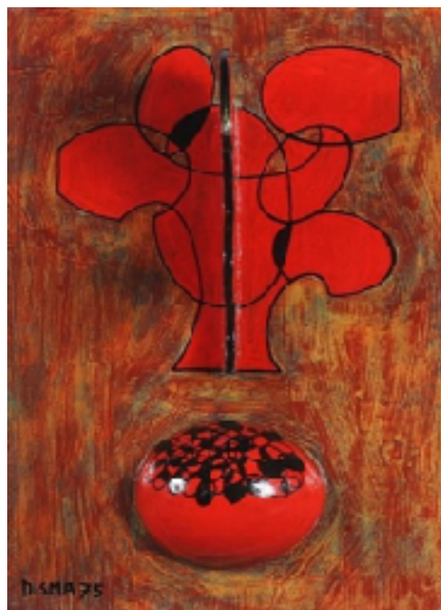
Disma Tumminello, “Logiche Caiya n.9”, tecnica mista su tavola 20,50 x 15,50 (1975)