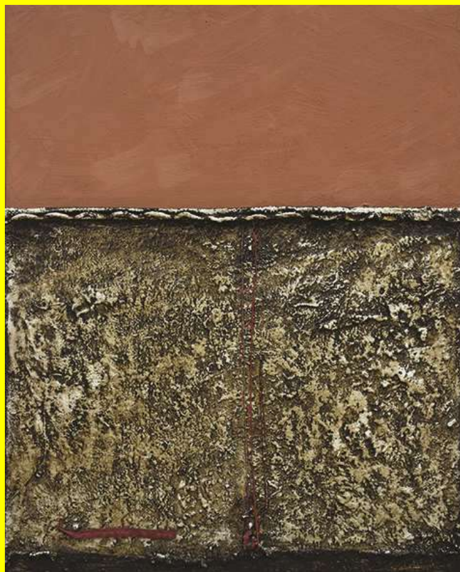
Simmetrie asimmetriche, tecnica mista