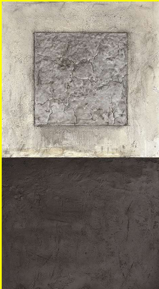
Terre emerse, tecnica mista